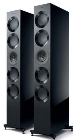
High-Gloss Black/ Grey