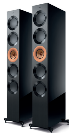
High-Gloss Black/ Copper