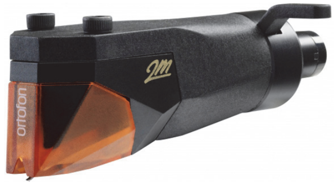
2M Bronze PnP