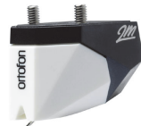
2M Mono Verso