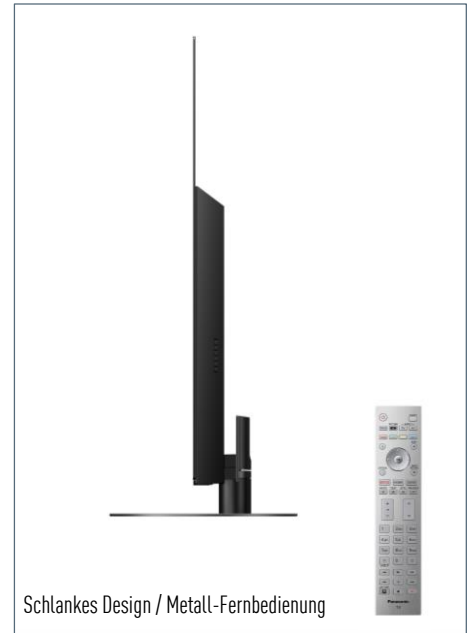
Schlankes Design / Metall-Fernbedienung

Neue Möglichkeiten des Fernsehens – Unterstützung von TV>IP, zahlreicher Apps und des HbbTV Operator App Standards