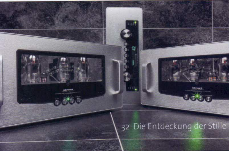
32 Die Entdeckung der Stille