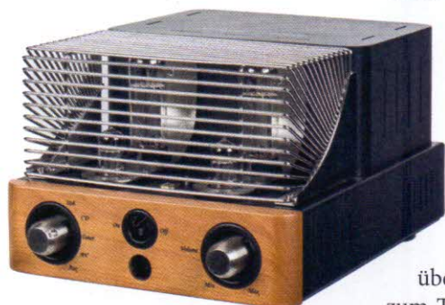
Die hübsche Holzfront gibt's auch in dunkel mit hellen Holzeinsätzen

Der bildhübsche kleine Italiener ist nach wie vor ein waschechter Single-Ended-Verstärker, bei dem eine Pentode vom Typ EL34 zum Eintaktbetrieb gebeten wird. Unison bietet dabei zwei Betriebsarten an, zwischen denen man per Kippschalter wählen kann: waschechter Triodenbetrieb oder Ultralinearbetrieb mit genau dosierter Gegenkopplung von der Primärseite des Ausgangsübertragers aus. Im letzteren