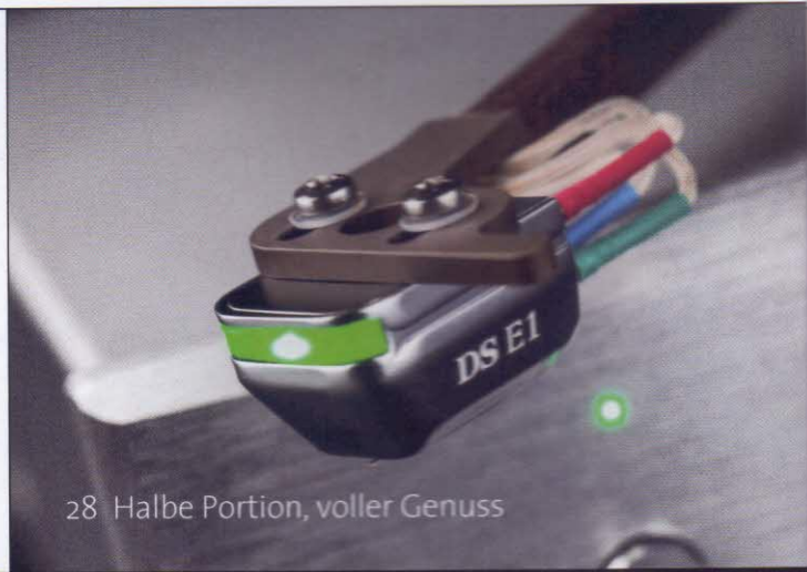
28 Halbe Portion, voller Genuss