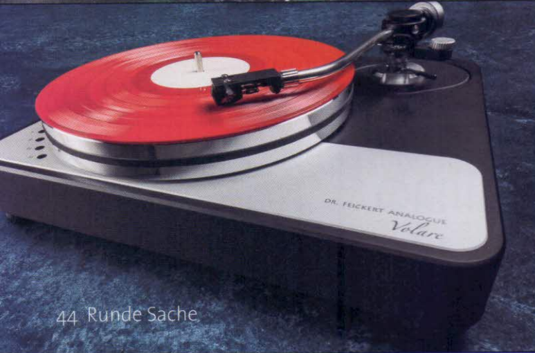
44 Runde Sache