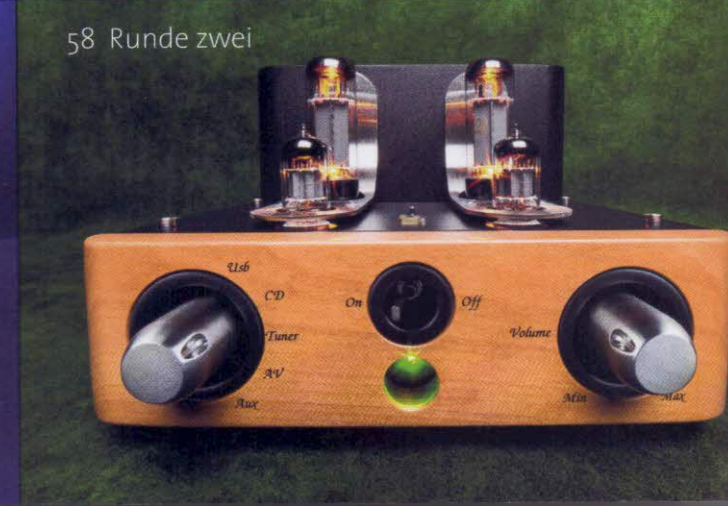
58 Runde zwei