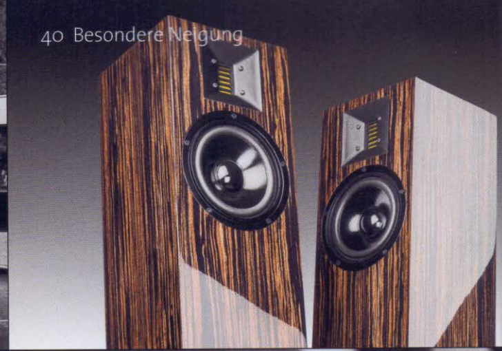
40 Besondere Neigung