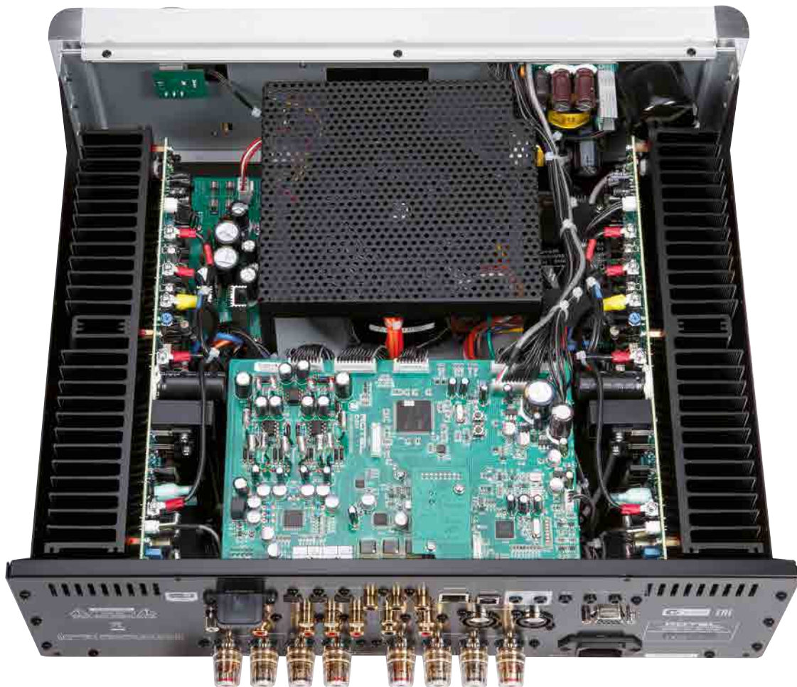
▼ Der mächtige gekapselte Trafo, links und rechts umgeben vom Endstufentrakt; im Vordergrund das Wandlerabteil