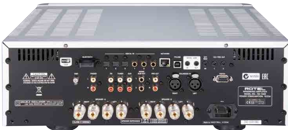
▲ Diverse Digital- und Analogeingänge inklusive XLR, zwei Lautsprecherpaare getrennt schaltbar