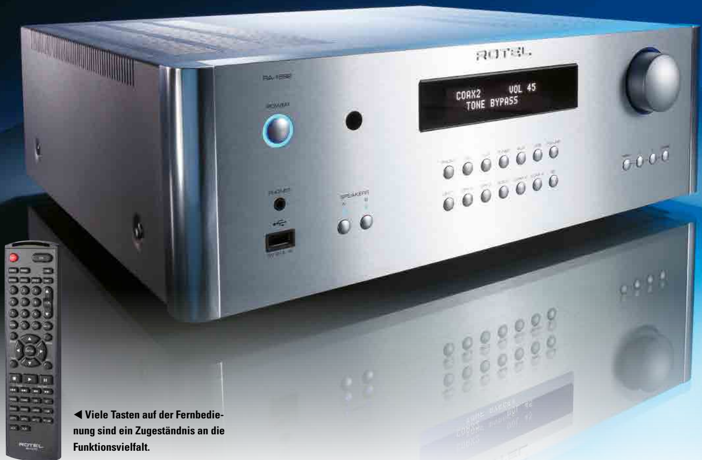
◀ Viele Tasten auf der Fernbedienung sind ein Zugeständnis an die Funktionsvielfalt.

Erneut greift die Bezeichnung Vollverstärker viel zu kurz – der Rotel RA-1592 ist ein Multitalent mit starken Muskeln