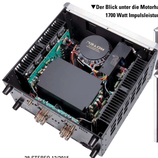
▼ Der Blick unter die Motorhaube zeigt, wo die fast 1700 Watt Impulsleistung herkommen.

Die zugehörige Vorstufe des Hauses ist eine Schaltzentrale par excellence. Die umfangreichen analogen Anschluss- und Einstellmöglichkeiten inklusive einem rauscharmen MM-Plattenspieleringang werden durch einen integrierten, leistungsfähigen DAC samt USB ergänzt, um auch im modernen Wohnzimmer die Verbindung zu PC/Mac sowie die adäquate Steuerung der Digitalquellen zu organisieren. Dazu gehört zudem die Möglichkeit, per hochwertiger, sprich: