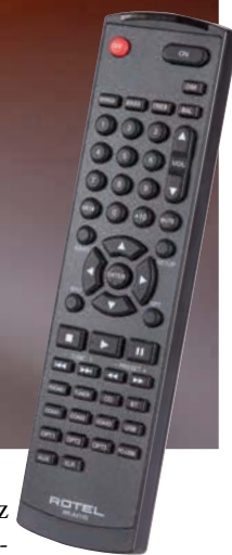
Die Fernbedienung der Rotel-Kombi ist üppig, aber nicht sehr übersichtlich.

Das mit Abstand beeindruckendste Schlachtschiff dieses Vergleichstests – weil rund doppelt so groß und mit 38 Kilogramm auch doppelt so schwer wie die anderen Dickschiffe – erreichte uns in Form des Rotel-Leistungsverstärkers. Kein Wunder also, dass dieses Gerät auch den Leistungswiderständen im STEREO-Labor mächtig einheizte. Was der Rotel im Zweikanal-Betrieb in die Lautsprecherkabel schiebt, kann man etwa Arcam oder Aurum nur entlocken, wenn