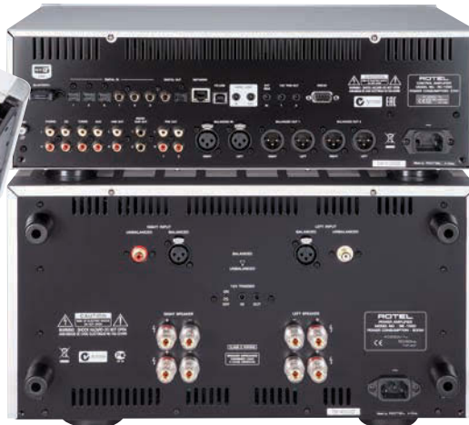
◀ Die DAC-Vorstufe bietet Plattenspieler- und Bluetooth-Wiedergabe, die 38-kg-Endstufe braucht reichlich Platz und eine stabile Standfläche.